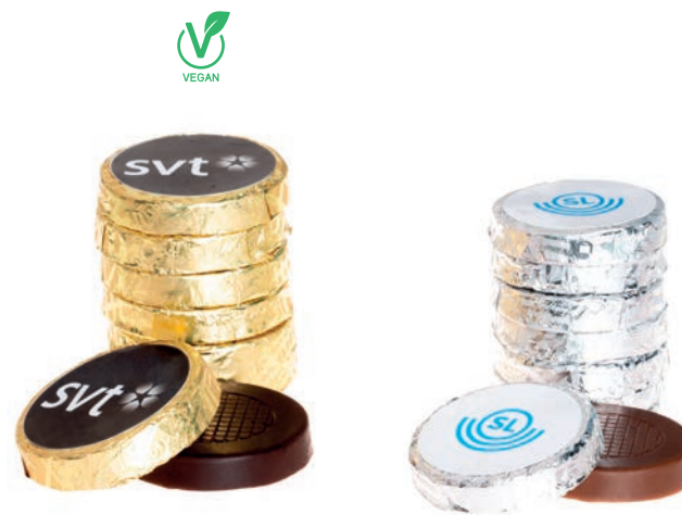
Art. 600 Mintcrisp (guldfolie)

Minsta order: 5 000 st Leveranstid: ca 4 veckor från godkänt korrektur Vikt: 5 g per st Hållbarhet: ca 1 år Tryckyta: 30 x 30 mm Tryckteknik: Blocktryck Förpackning: 1 000 st per kartong