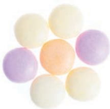
Art. 561 Frukt (apelsin, jordgubb, citron)