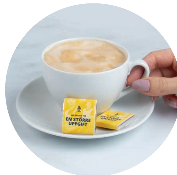
Chokladfyrkant till eftermiddagskaffet