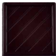
72 % kakao