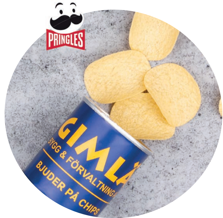
Pringles till företagsminglet

Minsta order: 100 st Leveranstid: ca 3 veckor från godkänt korrektur Vikt: 40 g per st Hållbarhet: ca 8 månader Tryckyta: 260 x 80 mm Tryckteknik: Digitaltryck