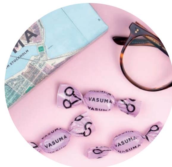
Karameller till butiksinvigningen