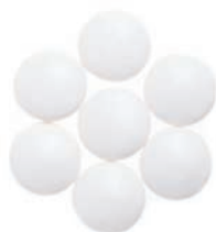
Art. 560 Mint