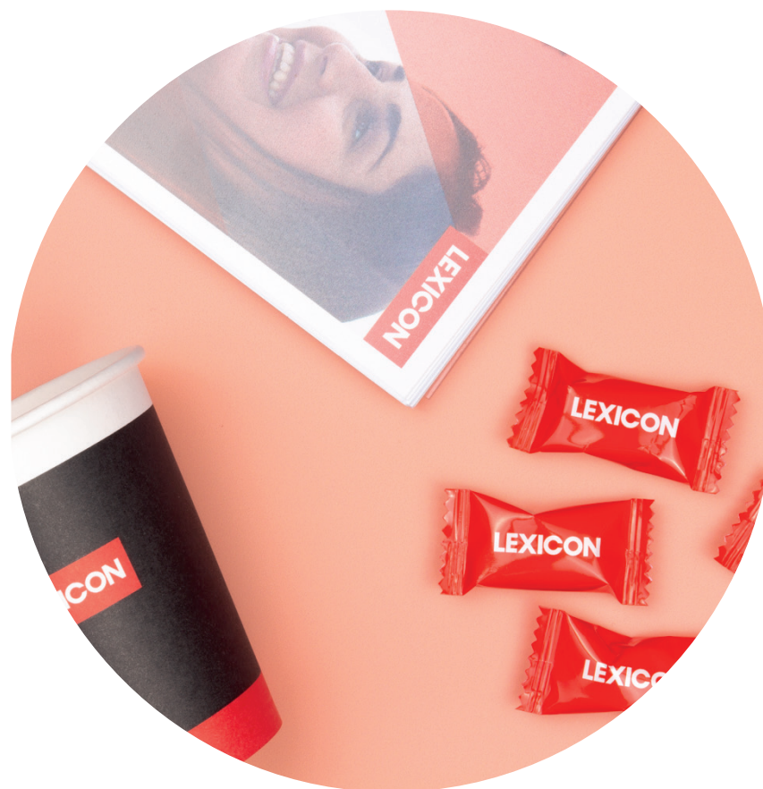
Chewys till konferensen