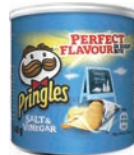
SALT & VINEGAR