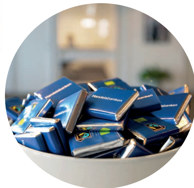
Chokladfyrkanter i receptionen

Minsta order: 1250 st för 72% kakao 25 000 st för Mjölchoklad Leveranstid: ca 4 veckor från godkänt korrektur Vikt: 5 g per st Hållbarhet: ca 1 år Tryckyta: 35 x 35 mm Tryckteknik: Digitaltryck/Offsettryck Förpackning: 625 st per kartong