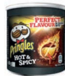
HOT & SPICY