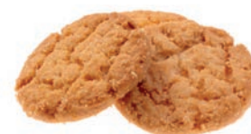
Art. 7622 Kolakakor i flowpack