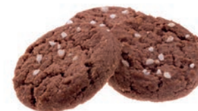
Art. 7623 Chokladkakor i flowpack