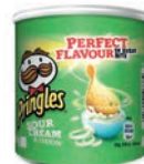
SOURCREAM & ONION

Minsta order: 100 st Leveranstid: ca 3 veckor från godkänt korrektur Vikt: 40 g per st Hållbarhet: ca 8 månader Tryckyta: 260 x 80 mm Tryckteknik: Digitaltryck